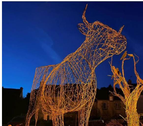
La vache, Festival Arts des villes Arts des champs, Malguenac, 2023

BUDGET : 25 000 € dont 2 000 € de valorisation bénévolat